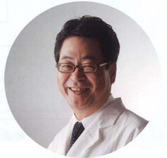
プレオルソ開発者・セミナー講師

数年前から、日常の臨床で使用できる治療方法および装置が確立し、一般歯科医や矯正専門医の先生方にもこの装置や治療方法を実際の臨床で導入して頂き、数々の良い結果の報告を得ております。当セミナーはマウスピース型装置を使った内容構成ではありますが、装置の販売が目的ではありません。